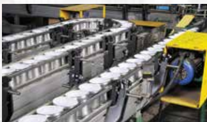
Tranquillità nella produzione