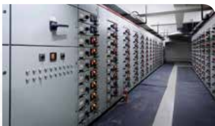
Monitoraggio costante di attrezzature critiche

Combinando una termocamera e una telecamera a luce visibile in un'unica soluzione compatta, AX8 misura solo 54 x 25 x 95 mm ed è facilmente installabile in aree con spazio limitato, per abilitare il monitoraggio di stato senza interruzioni di apparecchiature meccaniche ed elettriche di importanza critica.