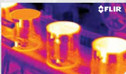
Rapida localizzazione delle variazioni di calore